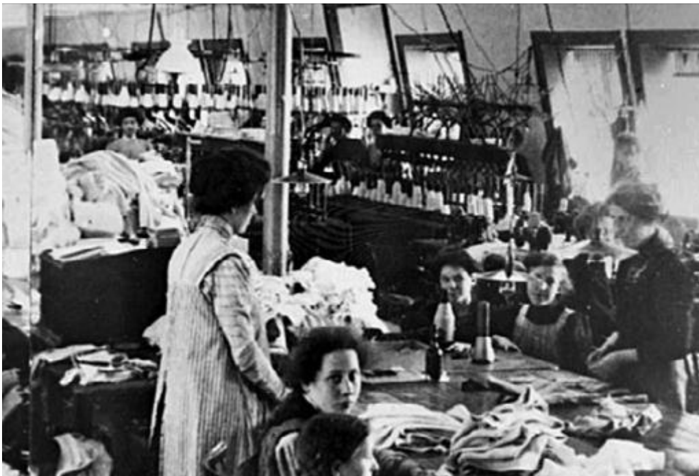
Malmö Mek(aniska) Tricotfabriks AB, början av 1900-talet.