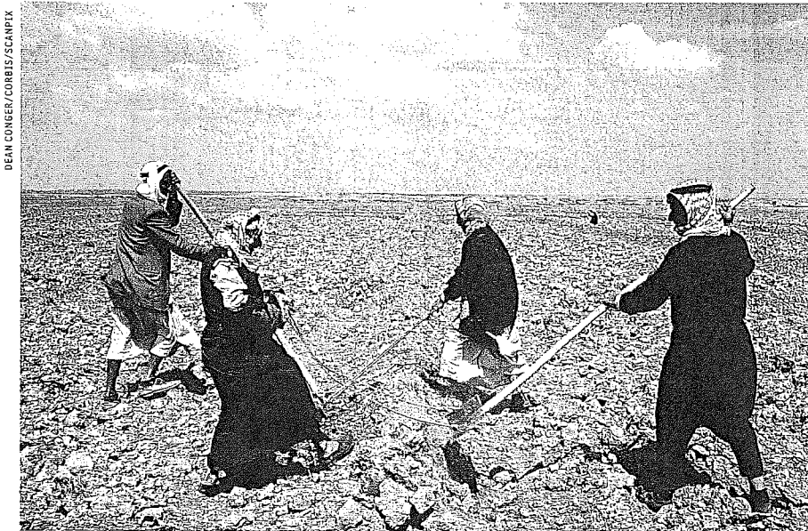
Jordbruk uppstod ganska samtidigt – efter den senaste istiden – på flera, och av varandra oberoende platser runtom i världen. Mellanöstern var en av dessa platser. Bilden visar nutida syriska bönder i Meskene.